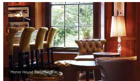
Manor House Bibliotheek