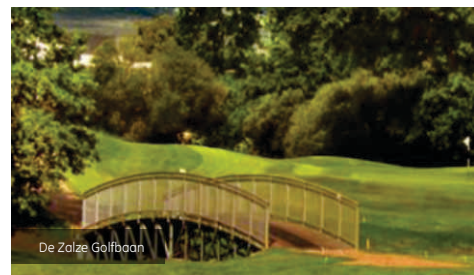
De Zalze Golfbaan