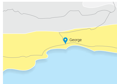
Pinnacle Point Golfbaan

Deze reisroute is geschikt voor de golf 'gek', die niet genoeg kan krijgen. Door gebruik te maken van het uitmuntende Fancourt Golf Resort als basiskamp, met 11 verschillende startpunten over verschillende golfbanen, bieden wij een nieuwe, unieke ervaring. U krijgt ook onbeperkte toegang tot de Fancourt faciliteiten, die momenteel gezien worden als de nieuwe tempel voor golf, u keert moe maar tevreden terug.